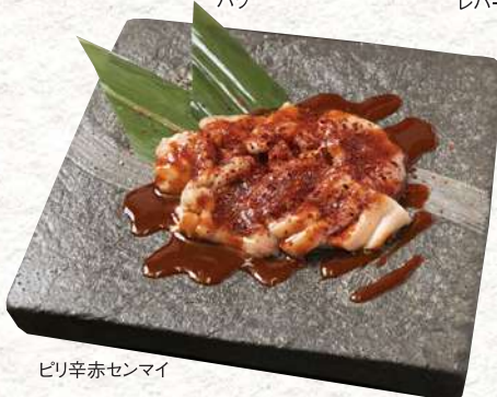
ピリ辛赤センマイ