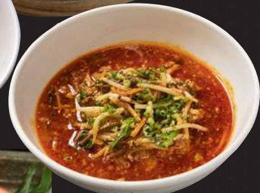
ユッケジャンクッパ