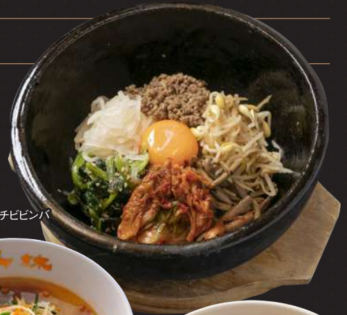
石焼キムチビビンバ