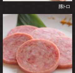
大判ロース一枚焼