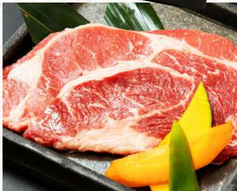
大判ロース一枚焼