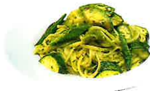
Avocado, Okra and Zucchini Genovese アボカドとokra、ズッキーニのジェノベーゼ