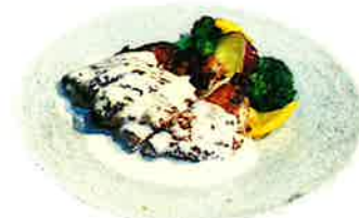
Grilled Chicken チキングリル ※一部店舗鉄板での提供となります