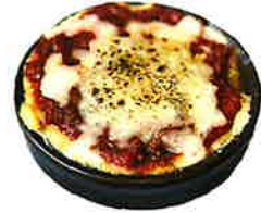
Grilled Beef ragoo and Mashed potatoes with Cheese 牛ラグーとマッシュポテトのチーズ焼き 780 (858 税込)