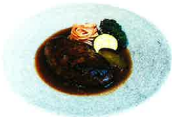
Tomato Demiglace Hamburg トマトデミグラスハンバーグ 1280 (1408 税込) ※一部店舗鉄板での提供となります