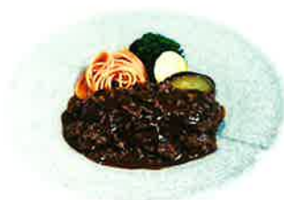
Curry-Hamburg カレーハンバーグ ※一部店舗鉄板での提供となります