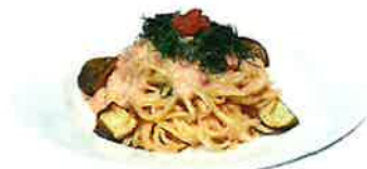
Potatoes and Perilla Spicy Fish Eggs Butter じゃが芋と大葉の明太バター