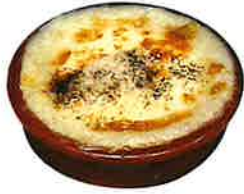
Oven-Baked Mashed Potato and Cheese マッシュポテトのチーズ焼き 680 (748 税込)