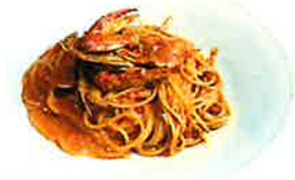
Migratory crab tomato cream 渡り蟹のトマトクリーム 1480 (1628 税込)