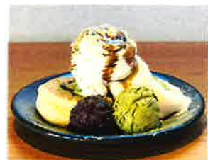
Matcha Red Bean Pancake 抹茶と大納言あずきのパンケーキ

パンケーキの上には求肥をのせて、 新食感パンケーキです。 濃厚抹茶アイスとあずきが 相性はばっちりです。 仕上げに黒蜜がたっぷりかかった パンケーキです (実際のアイスは中に隠れています)