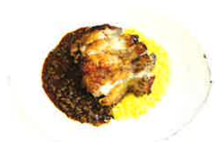
Risotto Curry with Chicken チキンリゾットカレー 1480 (1628 税込)