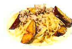
Cream of sweet potato and chicken flake サツマイモと鶏そぼろのクリーム