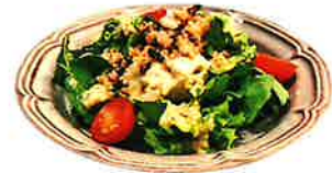
Five-grain rice and apple salad 五穀米とリンゴのサラダ