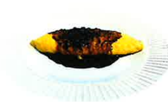
Truffle Omelette 名物! トリュフオムレツ(+110)