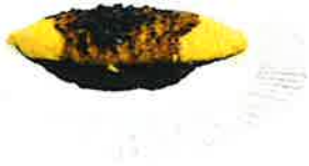
Truffle Omelette 名物! トリュフオムレツ 1380 (1518 税込)