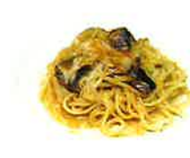
Sardine and dried mullet peperoncino 鰯とカラスミのペペロンチーノ