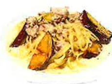
Cream of sweet potato and chicken flake サツマイモと鶏そぼろのクリーム 1280 (1408 税込)