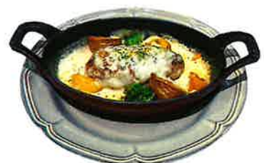
Gratin Hamburg グラタンハンバーグ 1280 (1408 税込)