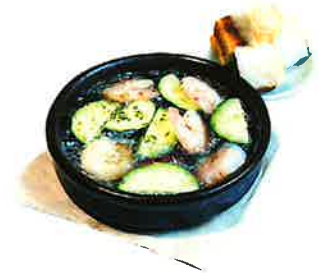
Shrimp and Zucchini Ajillo 海老とズッキーニのアヒージョ 780 (858 税込)