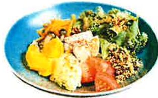
Cajun Chicken and Orange Cobb Salad ケイジャンチキンとオレンジのコブサラダ 980 (1078 税込)