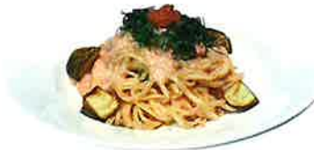
Potatoes and Perilla Spicy Fish Eggs Butter じゃが芋と大葉の明太バター 1280 (1408 税込)