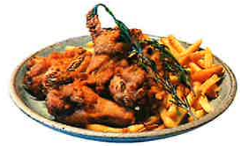
Fried Chicken and French Fries フライドチキン&ポテト 980 (1078 税込)