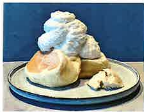
Plain Pancake プレーンパンケーキ

季節の旬のフルーツをふんだんに使った いいとこどりの贅沢パンケーキです。 中にはバナナアイスが隠れています。 甘さ控えめな生クリームとたくさんのフルーツに メープルシロップをかけてお召し上がりください。