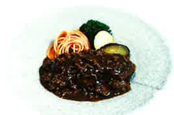
Curry Hamburg カレーハンバーグ 1280 (1408 税込) ※一部店舗鉄板での提供となります