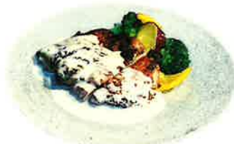
Grilled Chicken チキングリル 1280 (1408 税込) ※一部店舗鉄板での提供となります