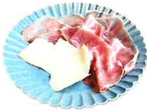
Prosciutto and Cheese 生ハムとチーズ 780 (858 税込)