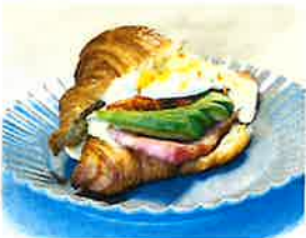
クロワッサンエッグベネディクト