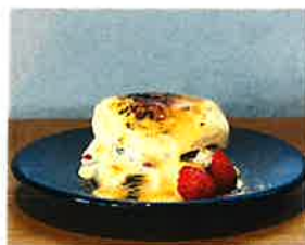
Strawberry Brulee Pancake 苺のブリュレパンケーキ

パンケーキの間にはカスタードソース と苺がたっぷり隠れています。 表面をこんがりブリュレしてあるので 外はパリパリ中はとろ〜りの パンケーキです。