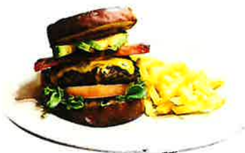
BLT Avocado Cheese Burger BLTアボカドチーズバーガー 1280 (1408 税込)