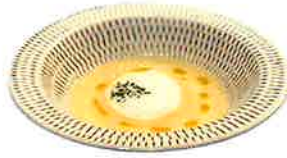
Corn Soup コーンスープ