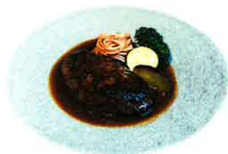
Tomato Demi glace Hamburg トマト デミグラスハンバーグ ※一部店舗鉄板での提供となります