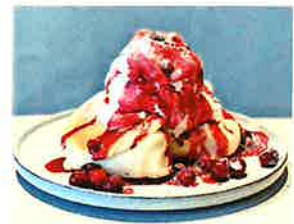
Berry Berry Pancake ベリーベリーパンケーキ

フランボワースソースをたっぷり かけました。ミックスベリーの 酸味とソースが相性抜群です。 中にはバナナアイスが隠れています