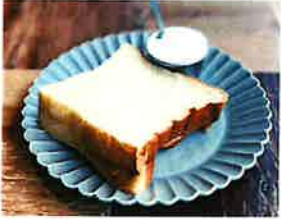
ワンハンドレッド