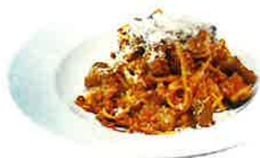
Beef and burdock bolognese 牛肉とゴボウのポロネーゼ