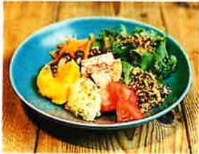
ケイジャンチキンとオレンジのコブサラダ