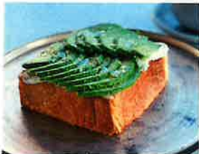
アボカドリコッタースト