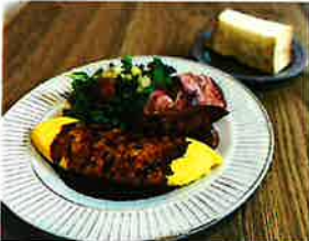
トリュフオムレツブレックファースト