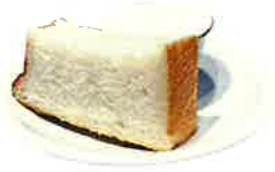
One Hundred ワンハンドレッド (追加1カット198円)