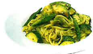
Avocado, Okra and Zucchini Genovese アボカドとokra、ズッキーニのジェノベーゼ 1280 (1408 税込)