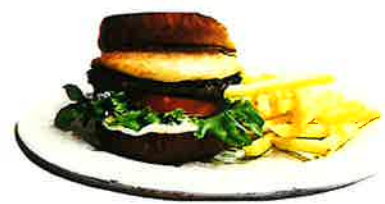
Smoked Mozzarella Burger 燻製モッツアレラバーガー 1280 (1408 税込)