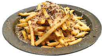
Truffle Cheese French Fries トリュフチーズフレンチフライ 680 (748 税込)