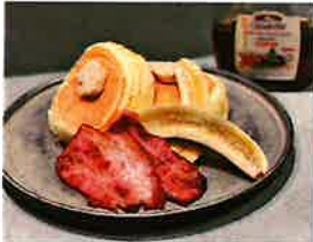
ニューヨーカーパンケーキ