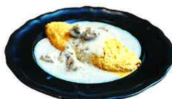
Mushroom cream Omelette きのこクリームオムレツ