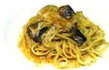
Sardine and driedmullet peperoncino 鰯とカラスミのペペロンチーノ 1280 (1408 税込)