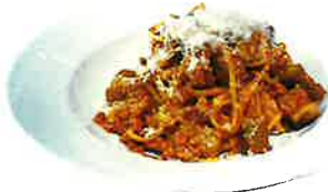
Beef and burdock bolognes 牛肉とゴボウのボロネーゼ 1280 (1408 税込)