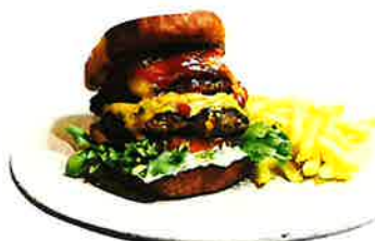
Double Cheese Double Burger ダブルチーズダブルバーガー 1480 (1548 税込)