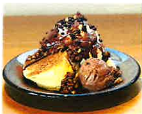
Triple Choco Pancake トリプルチョコパンケーキ

チョコソース、チョコレートアイス、 チョコクランチが乗った、チョコ 好きにはたまらないパンケーキです。 ココアクッキーのザクザクがいい アクセントになっています (実際のアイスは中に隠れています)