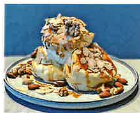
Salted Caramel Pancake 塩キャラメルパンケーキ

甘過ぎず程よい苦みの 自家製キャラメルソースです。 上から岩塩がかかっています。 中にはバナナアイスが隠れています