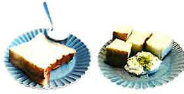
Onehundred Ricotta Cheese with Onehundred 单品ワンハンドレッド リコッタチーズと ワンハンドレッド 480 (528 税込) 780 (858 税込)