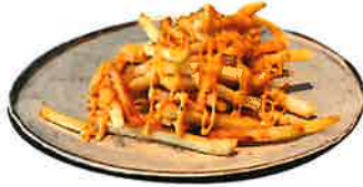
Cheddar Cheese French Fries チェダーチーズフレンチフライ 680 (748 税込)