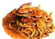
Blue Crab Tomato Cream 渡蟹トマトクリーム (+220)