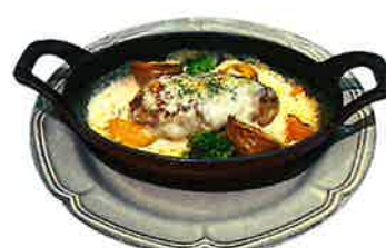
Gratin Hamburg グラタンハンバーグ